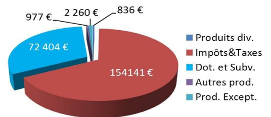
Fonctionnement Recettes : 230 618 €