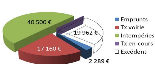
Investissement Dépenses : 60 253 €