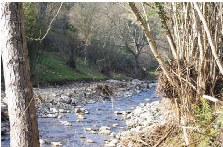
L'eau, un bien précieux à préserver.