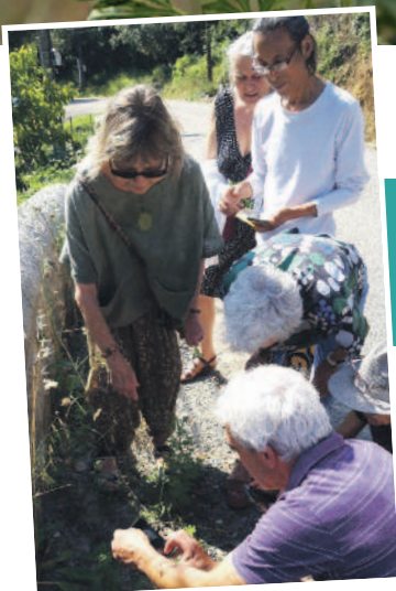
À la découverte de l'envahisseur...