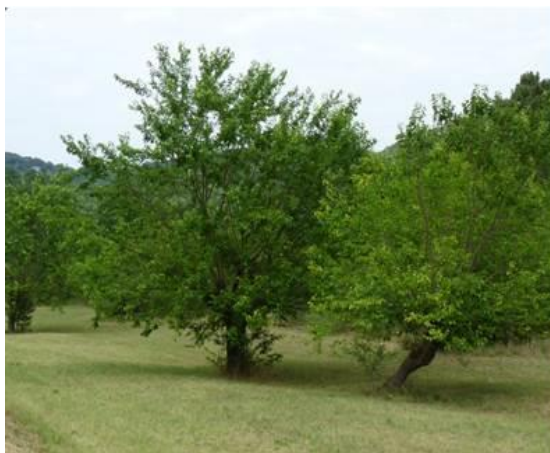
Mûriers à Yvoulas, témoins de la sériciculture