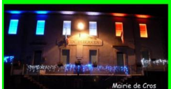
Mairie de Cros

L'équipe municipale vous souhaite pour 2020 la réussite de vos projets les plus chers